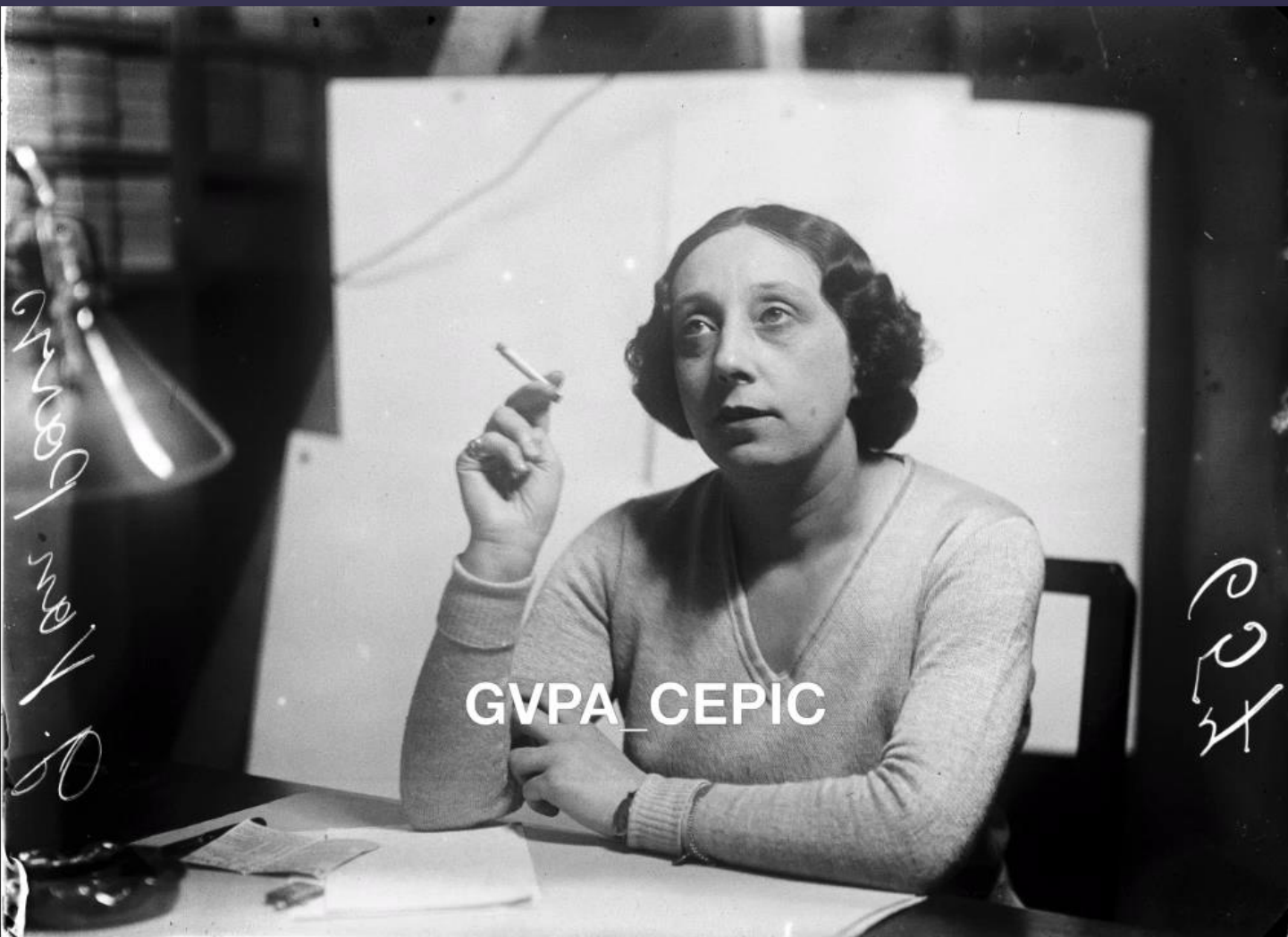
La première femme photographe de presse en Belgique