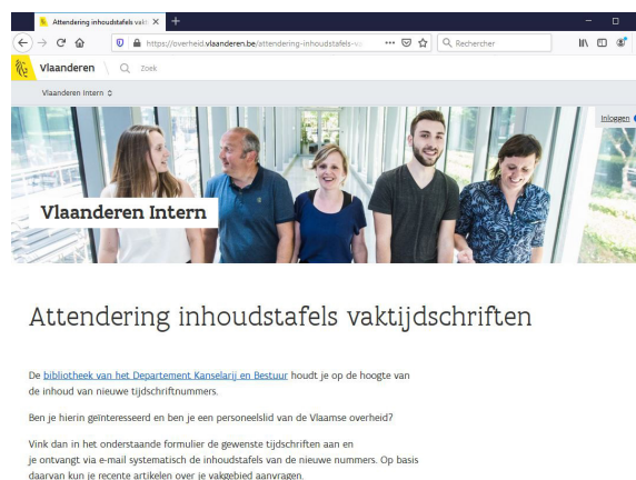
Fig. 1: Attending inhoudstafels vaktijdschriften bij de Vlaamse overheid

Wie krijgt er de dag van vandaag niet 'ter attending' een e-mail zoals menig gebruiker van de KU Leuven bibliotheken van welke publicaties hij/zij in bezit