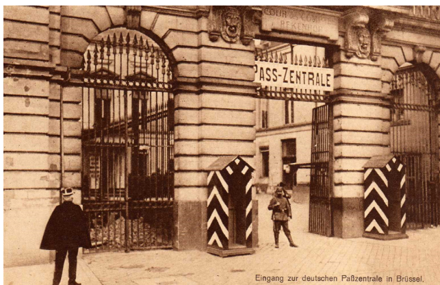
Fig. 2: De controle der 'paspoorten' was in handen van de Duitse bezetter. Bron: Duitse postkaart uit de privé-collectie Rainer Hiltermann (CegeSoma) 'Eingang tot de Pass-Zentrale te Brussel'.