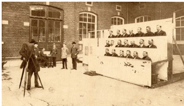
Fig. 3: Collectieve foto's voor de identiteitskaart werden genomen door de Duitse bezetter. Dit was gebaseerd op economische maatregelen ten gevolge schaarste.