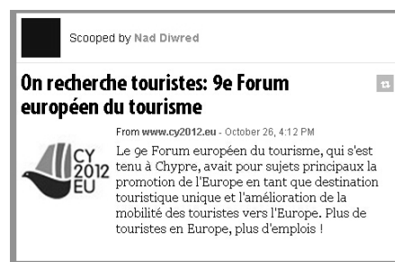
Fig. 4 : Détail d'un "post".