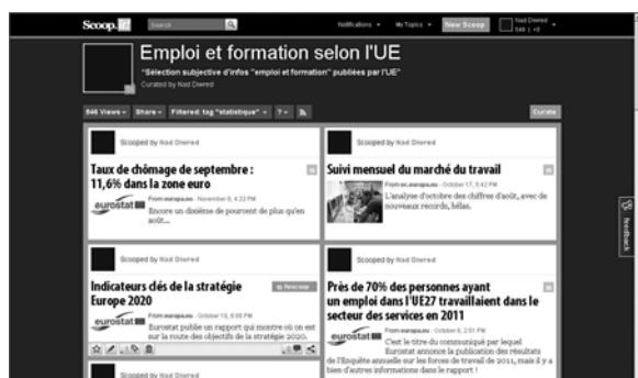
Fig. 5 : Résultat d'une recherche sur le "tag" "Statistique".

Rien ne garantit la pérennité de ce produit. Il s'agit d'un produit commercial, sur lequel nous n'avons pas la main, et en tant qu'utilisatrice de la version gratuite, je ne pourrais sûrement pas me plaindre d'une éventuelle disparition. Il faut simplement en assumer le risque. J'ai été encouragée dans l'acceptation de ce risque par le fait que, pour des raisons techniques (gestion de l'espace disque, du moteur de recherche et du coût de sa licence), il nous a été demandé de supprimer les articles des newsletters et les actualités rédigées avec l'outil de gestion de contenu interne. Finalement, les outils sur lesquels on pense avoir la main ne sont pas forcément ceux qu'on croit !