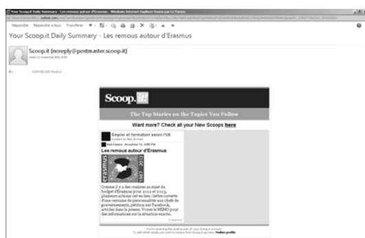
Fig. 3 : Message d'alerte.

Les collègues ont été avertis de l'existence de la plateforme et du fait qu'elle remplace en quelque sorte la lettre d'information. Son fonctionnement n'est toutefois pas le même que celui de la lettre d'information, qui était envoyée par messagerie dans sa totalité