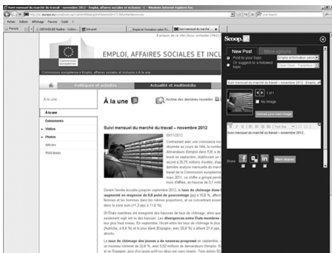
Fig. 2 : Ajout d'un "post".

Scoop.it est un produit standard disponible sur http://www.scoop.it . Il suffit de créer un compte et on peut directement créer un "topic" auquel on va ajouter des "posts". La paramétrisation est minimale. Il n'est donc pas nécessaire de définir précisément les besoins, de valider une analyse, de tester des développements informatiques. Bien sûr on est contraint de se contenter des fonctionnalités du produit, mais cela évite des questionnements, des prises de décision et des tergiversations consommant du temps et parfois n'apportant que peu de valeur supplémentaire.