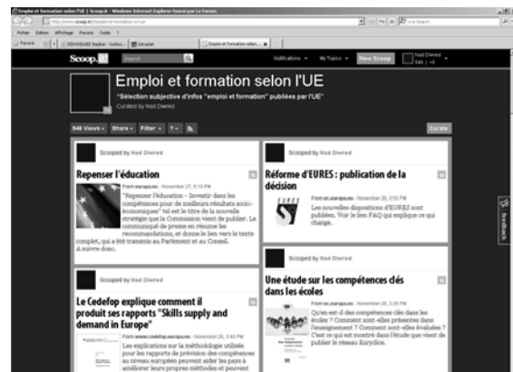
Fig. 1 : Page d'accueil de la plateforme.

Au niveau international, la veille porte sur l'Organisation de Coopération et de Développement économique (OCDE) et l'Organisation internationale du Travail (OIT).