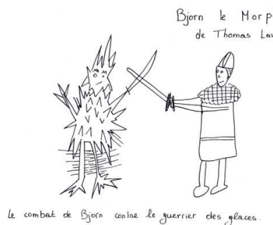
Fig. 1 : illustration de Björn le Morp.