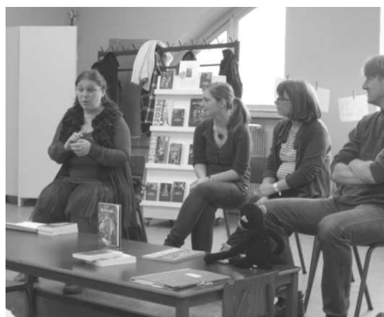
Fig. 3 : rencontre.