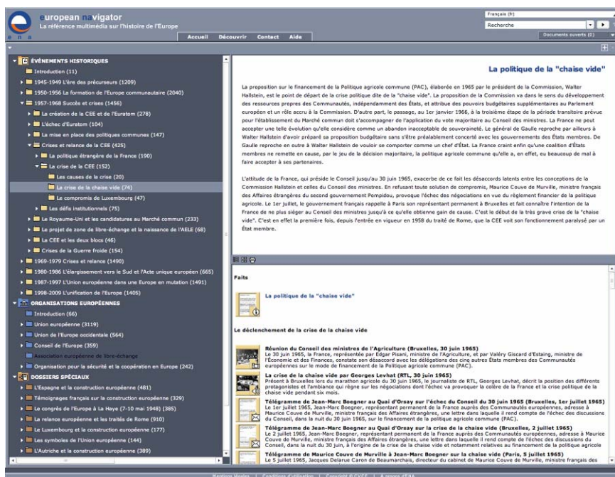
Fig. 1 : La bibliothèque numérique ENA, une mine d'informations sur l'histoire de l'Europe unie.

< http://www.ena.lu >. ENA donne accès à plus de 16.000 documents multimédias et multilingues, provenant d'origines très variées, dans le but d'illustrer les grands moments de l'histoire de l'Europe unie de 1945 à nos jours et de favoriser la découverte du fonctionnement des principales organisations européennes dans une perspective historique. Des textes fondateurs ou fondamentaux, des articles de