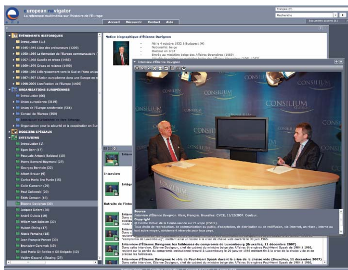
Fig. 4 : Capture d'écran de la bibliothèque numérique ENA montrant un entretien réalisé par le CVCE avec l'ancien vice-président de la Commission européenne Étienne Davignon.

Aujourd'hui reconnue et largement pratiquée par les historiens professionnels, l'histoire orale permet de mieux comprendre les choix, les expé-