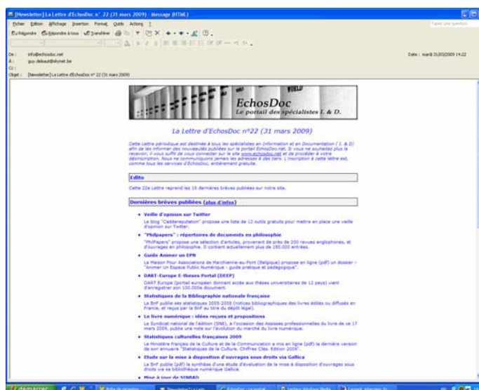
Fig. 2 : La Lettre d'EchosDoc.

Il répondait en effet à de nombreuses demandes de nos utilisateurs. Sa périodicité est mensuelle mais, de nouveau, suite à des sollicitations répétées, nous envisageons d'augmenter sa fré-